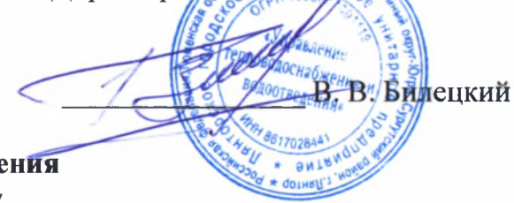
График отключения горячего водоснабжения потребителей г. п. Лянтор в 2018 году