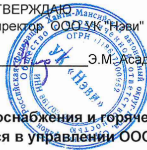
ГРАФИК промывки внутридомовых сетей теплоснабжения и горячего водоснабжения жилищного фонда, находящегося в управлении ООО УК "Нэви", на 2023 год