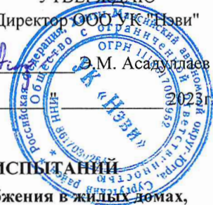
ГРАФИК ПРОМЫВКИ И ИСПЫТАНИЙ внутридомовых сетей теплоснабжения в жилых домах, находящихся в управлении ООО УК "Нэви", на отопительный сезон 2023-2024 годов по деревянному жилому фонду